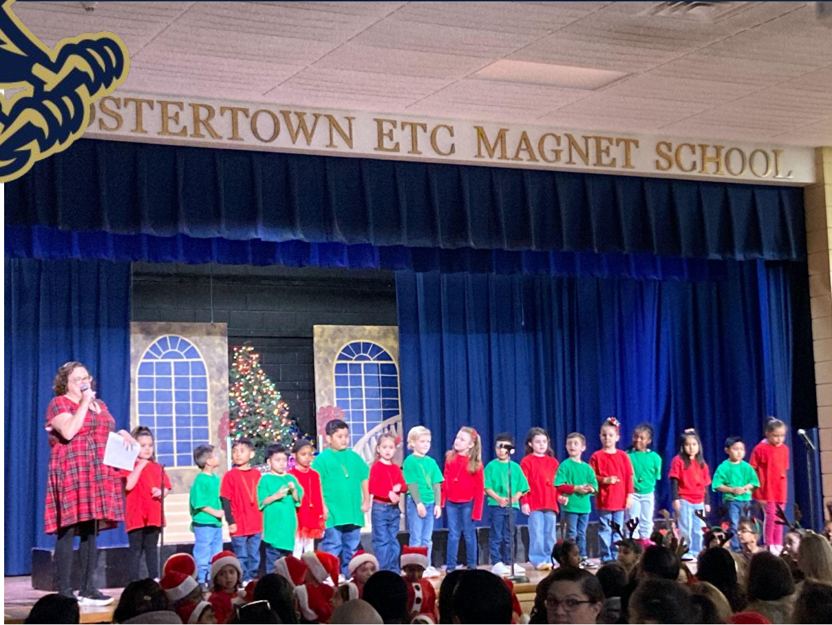
Fostertown Kindergarten Song Swap